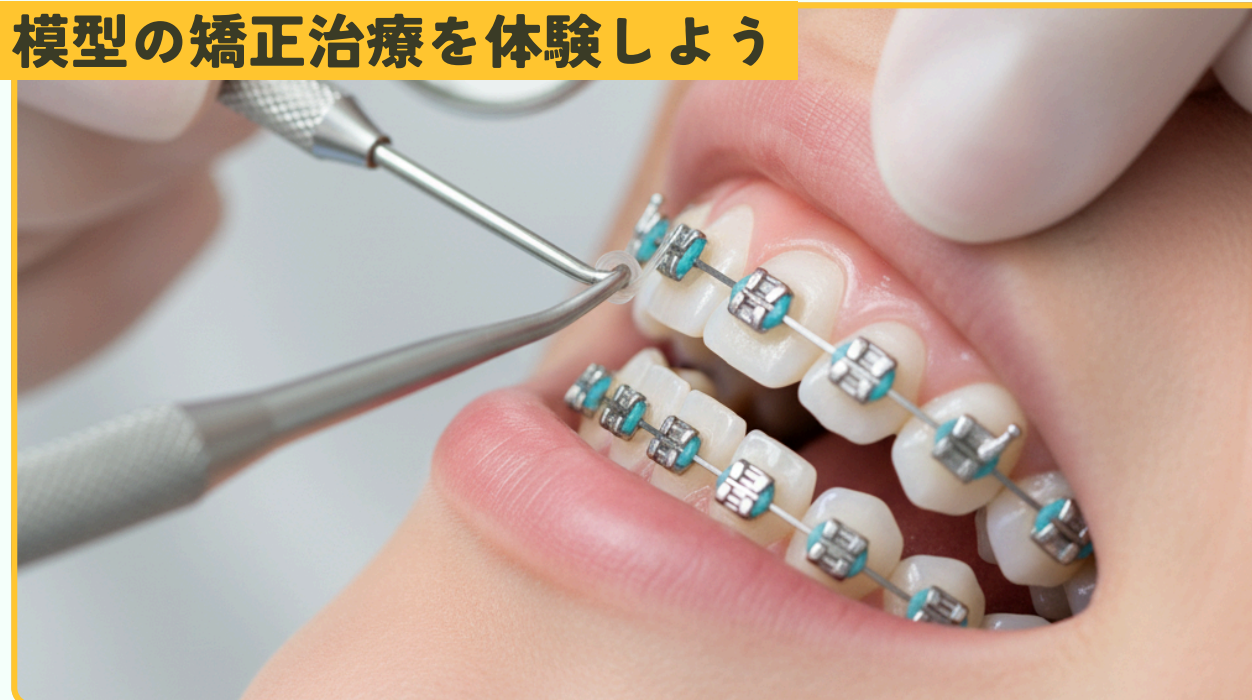
模型の矯正治療を体験しよう