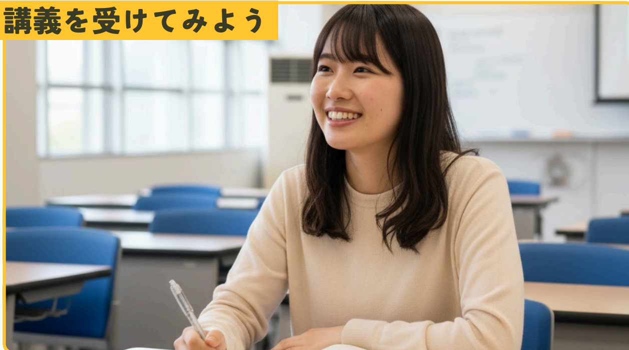
講義を受けてみよう