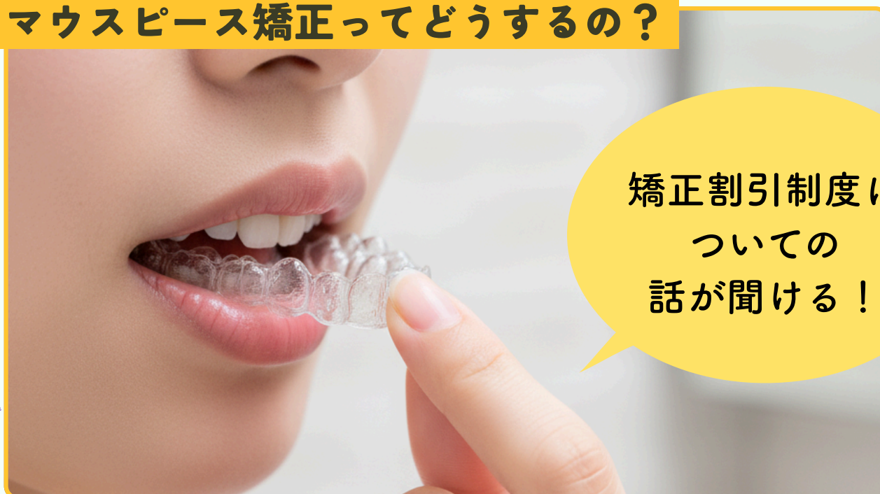
マウスピース矯正ってどうするの？